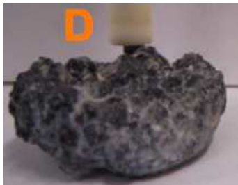
Катод после электролиза

Наноматериал в виде волокон (нитей) можно получать из воздуха. Для этого один из его компонентов растворяют в расплавленной смеси, состоящей из соли и оксида одного и того же металла (соль содержит 18.9% металла по массе, а оксид – 46.7% металла), добавляют следовые количества никеля и подвергают расплав электролизу со стальным катодом и никелевым анодом. Подбирая условия электролиза (концентрацию соли в оксида, плотность тока и количества примесей), можно получить материал, состоящий из прямых нитей, почти одинаковых по ширине.